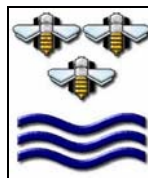
PROVINCIA DI TERNI